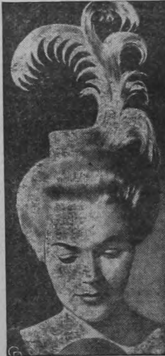
Uno de los peinados presentados en la Exposición de Peluqueros Alemanes fue este modelo de fantasía, denominado "Rey de las Ranas". (IUP)