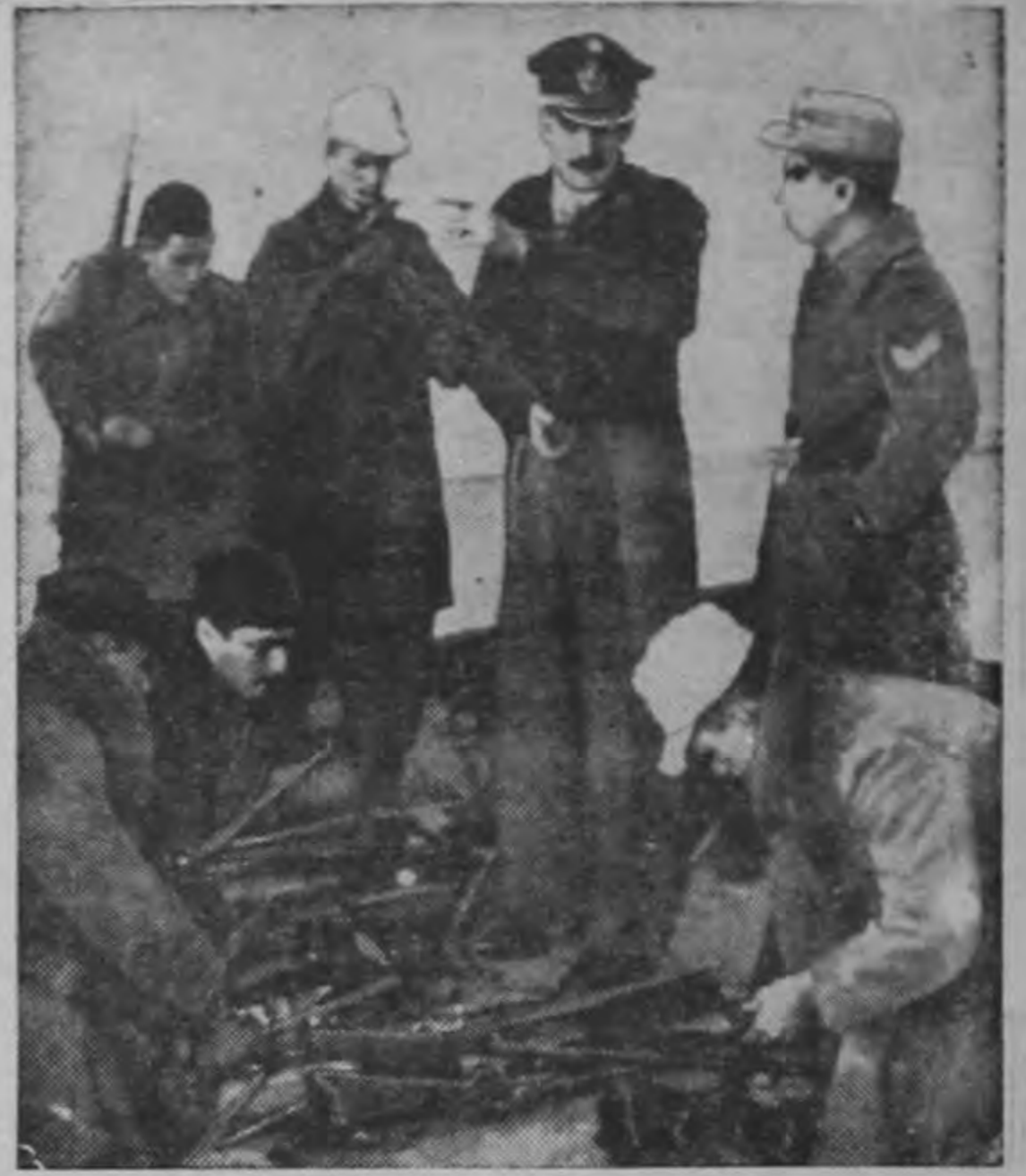
Soldados del gobierno examinan las armas capturadas, a los rebeldes bombardeados en el cuartel de La Plata, una de las cuatro ciudades donde los peronistas hicieron un levantamiento en Argentina. El régimen militar sigue ahora una decidida búsqueda de los líderes de la revolución que duró 12 horas. Más de 40 han sido fusilados.