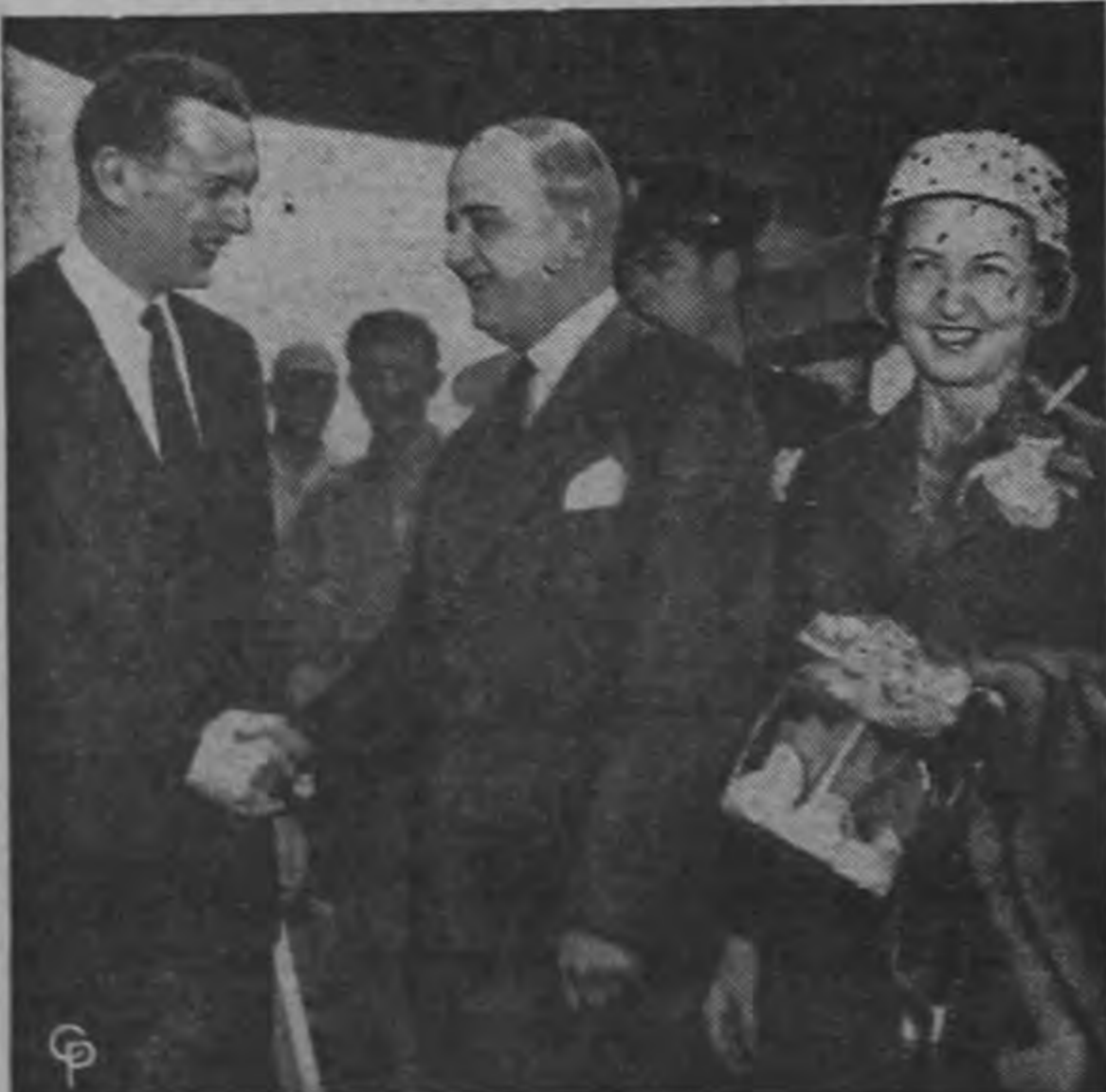
El Ministro del Exterior francés M. Christian Pineau, al llegar al aeropuerto de Idlewild, Nueva York, de París, saludado por Couve de Murville, (izquierda) embajador francés en Estados Unidos. A la derecha Madame Pineau.