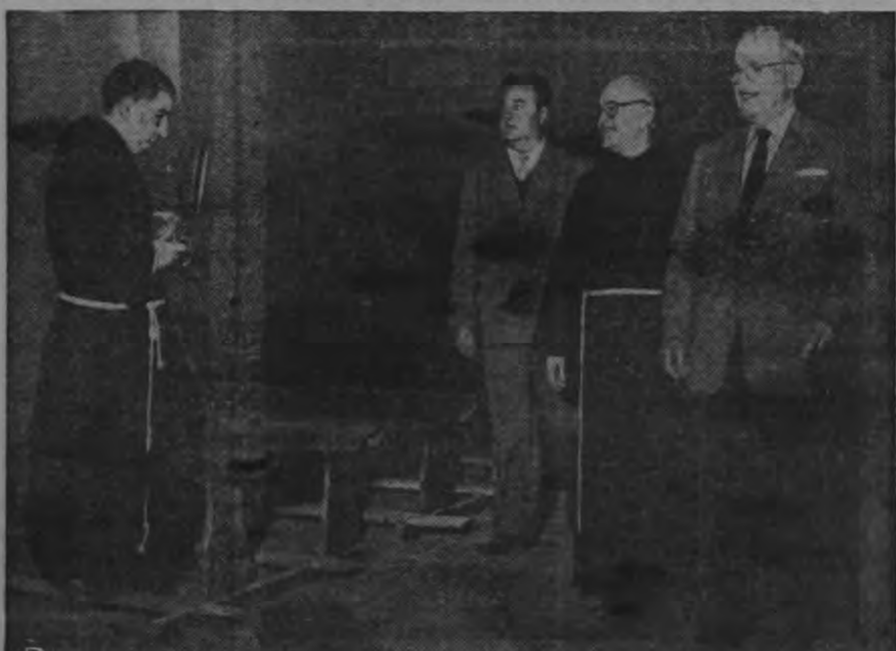
El expresidente norteamericano Harry S. Truman se detiene en el monasterio de San Francisco de Asis, en Italia construido en el siglo segundo para dar a un fraile franciscano tiempo de enfocar su cámara fotográfica muy del siglo XX, (INP)—