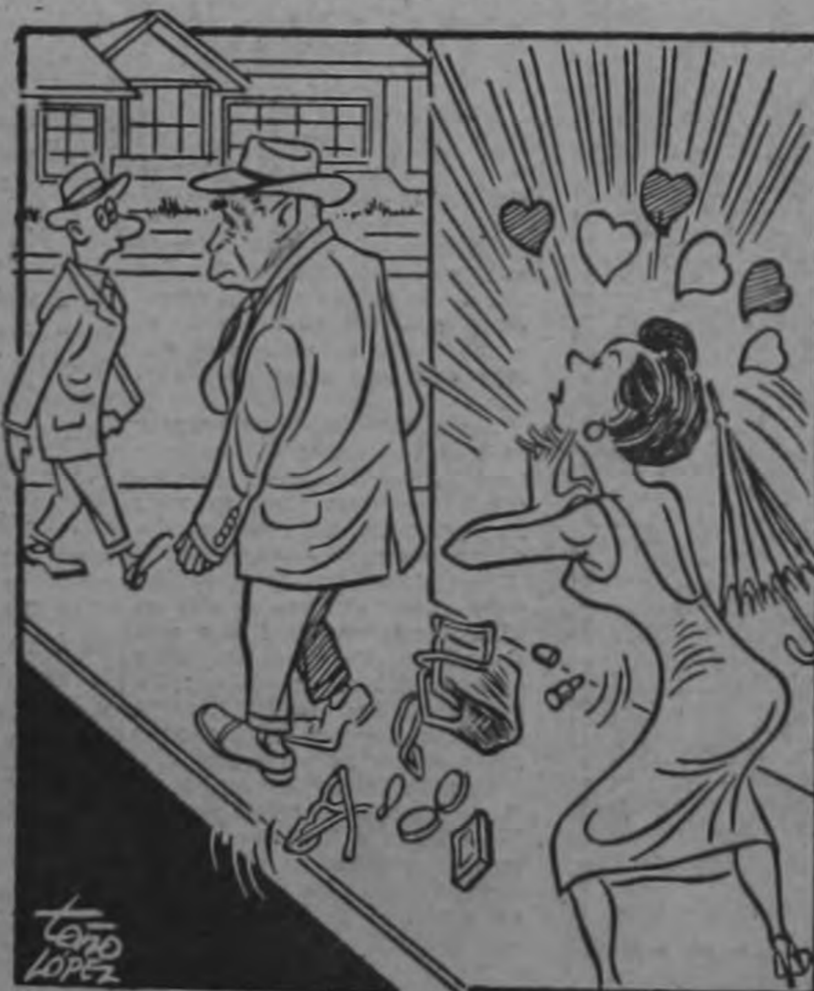
ELLA.—Ayl don Oti... tan "mono". 11