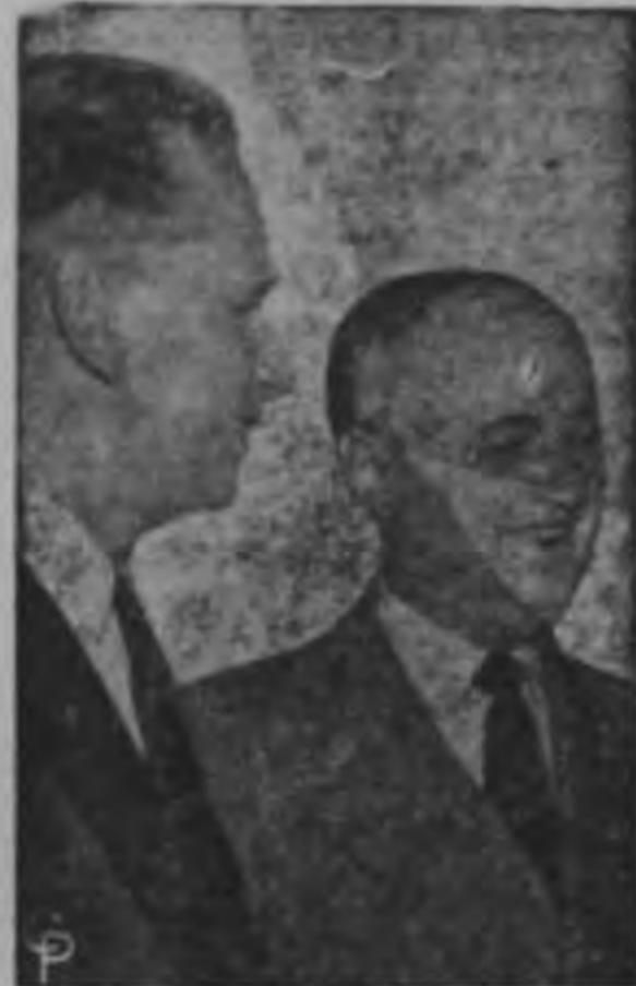
El Canciller de Alemania Occidental Konrad Adenauer con el Secretario de las Naciones Unidas Dag Hammarskjöld.

El día último del presente mes y el primero de julio, se llevará a cabo un gran Turno, a beneficio de la Escuela de San Antonio de Escazú. Muchos preparativos se hacen para el mismo.