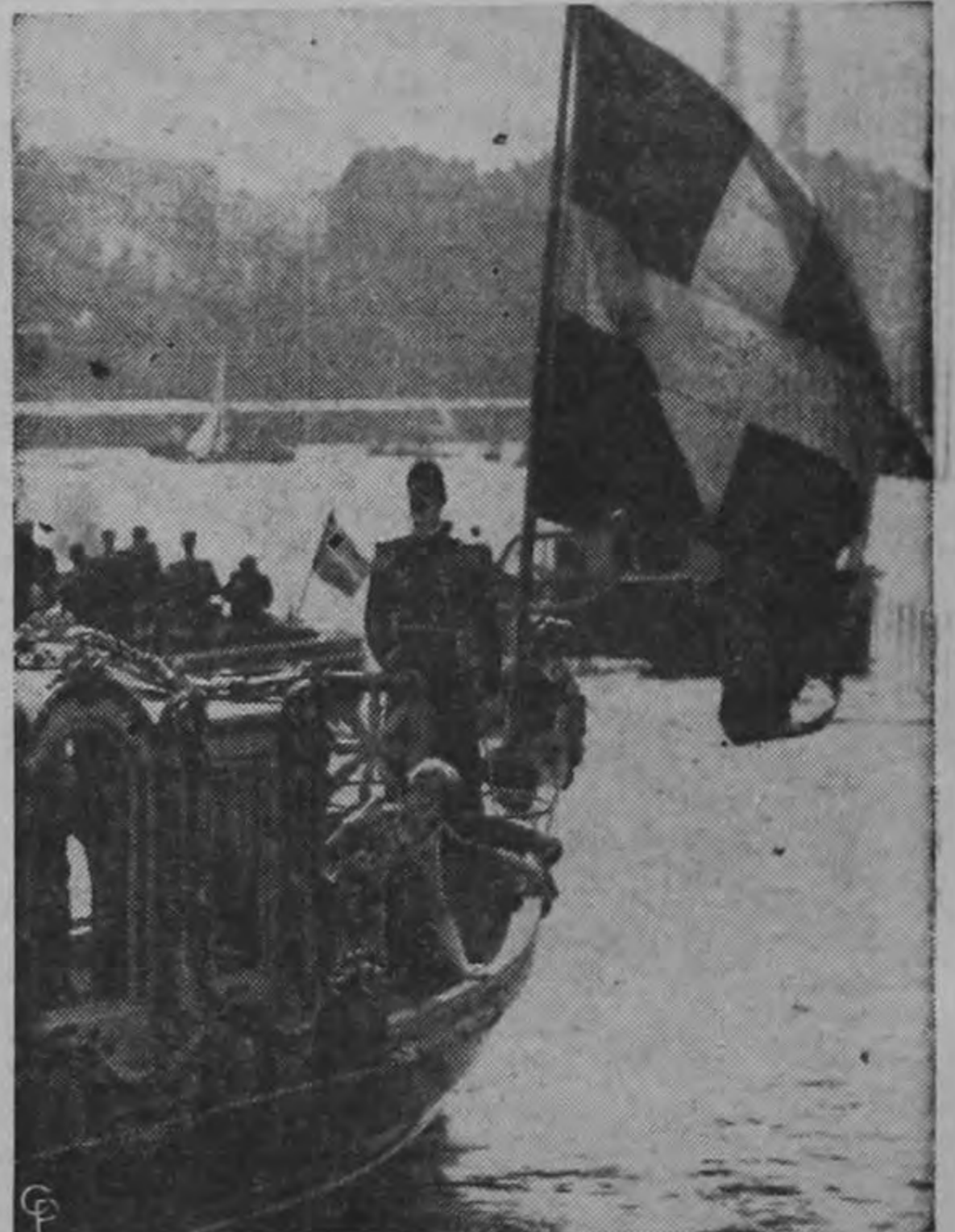
Mirando hacia un costado para ver hacia dónde va la Reina Isabel II de Inglaterra aparece a bordo de la lancha oficial del Rey Gustavo de Suecia. La Reina llegaba para un almuerzo ofrecido por el Consejo Municipal en el ayuntamiento de Estocolmo como parte de la recepción a Su Majestad en su visita a aquel país escandinavo.