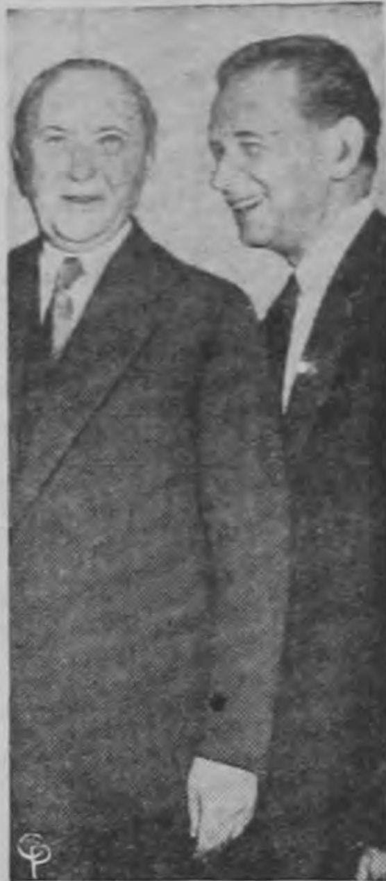
El Secretario General de las Naciones Unidas Dag Hammarskjöld (izquierda) con el ministro del exterior francés Christian Pineau a la llegada de este último a Nueva York