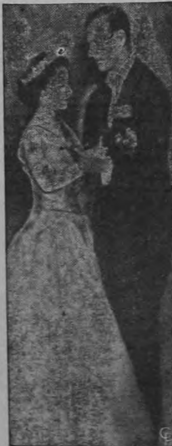
La Reina Isabel de Inglaterra y su esposo el Duque de Edimburgo bailando en Estocolmo, Suecia, donde hacen una visita oficial.